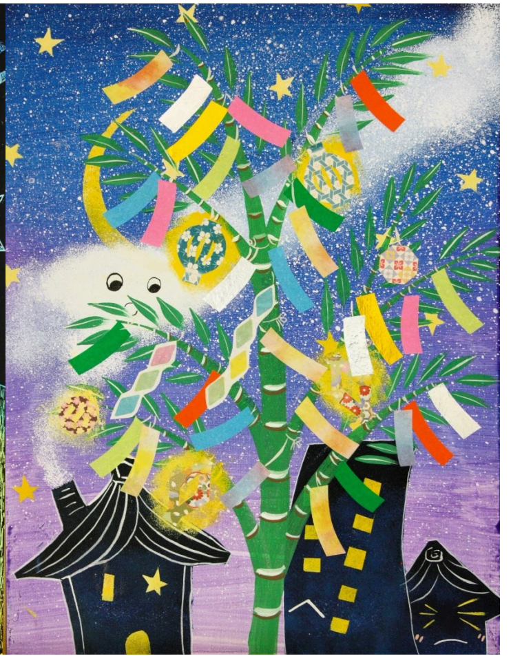
★ アクリル絵の具+折り紙