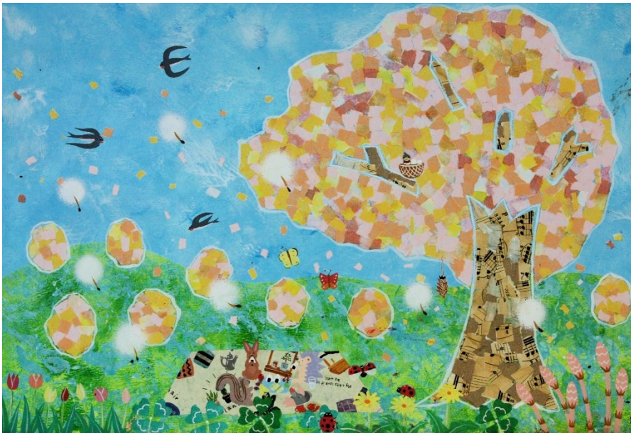
★★★★ アクリル絵の具+折り紙