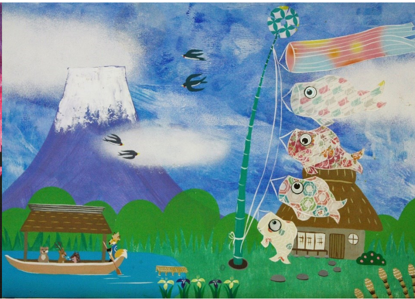
★★ アクリル絵の具+折り紙