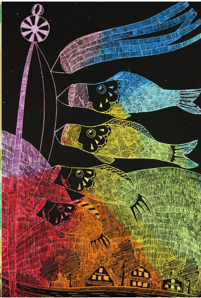
★ アクリル絵の具+クレヨン