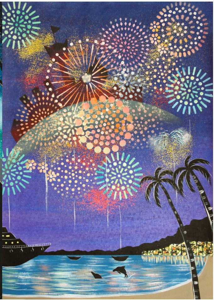
★★ アクリル絵の具+ラメ