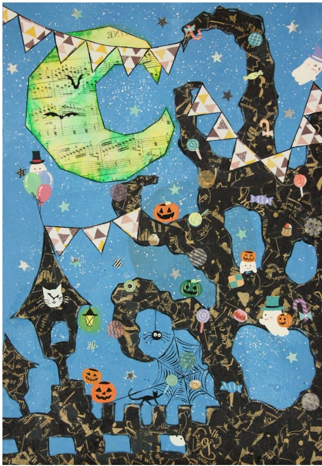
★★★★ アクリル絵の具+転写+折り紙