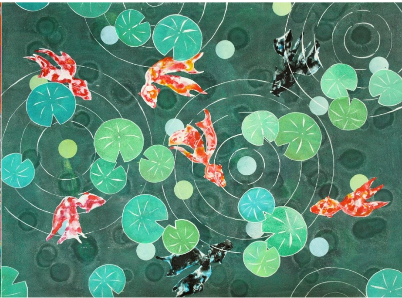
★★ アクリル絵の具+アルコール