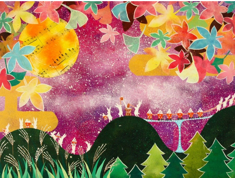
★★ アクリル絵の具+転写+折り紙