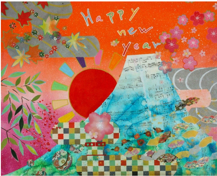
★★ アクリル絵の具+転写+折り紙