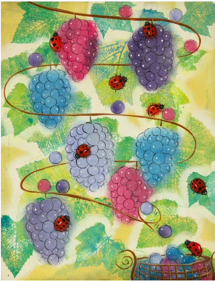
★★ アクリル絵の具+葉っぱ