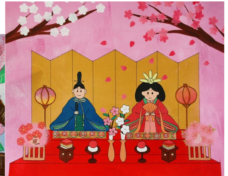
★ アクリル絵の具+折り紙