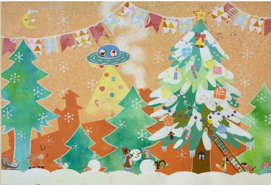
★★★ アクリル絵の具+折り紙