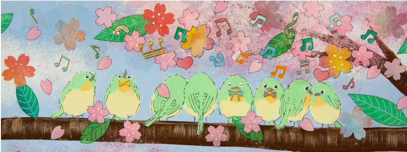
★ アクリル絵の具+折り紙+シール