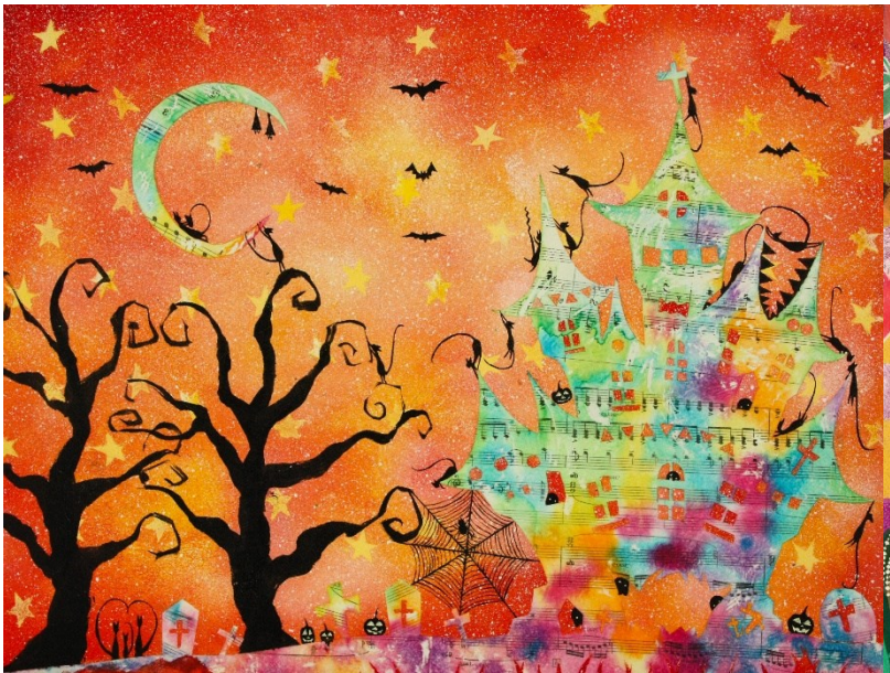
★★ アクリル絵の具+転写