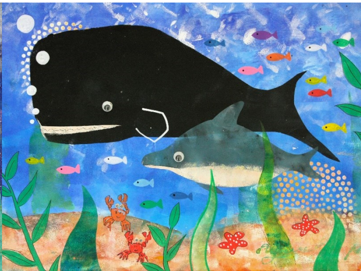
★ アクリル絵の具+ポスカ