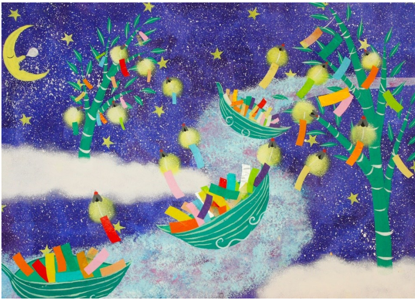
★★ アクリル絵の具+折り紙