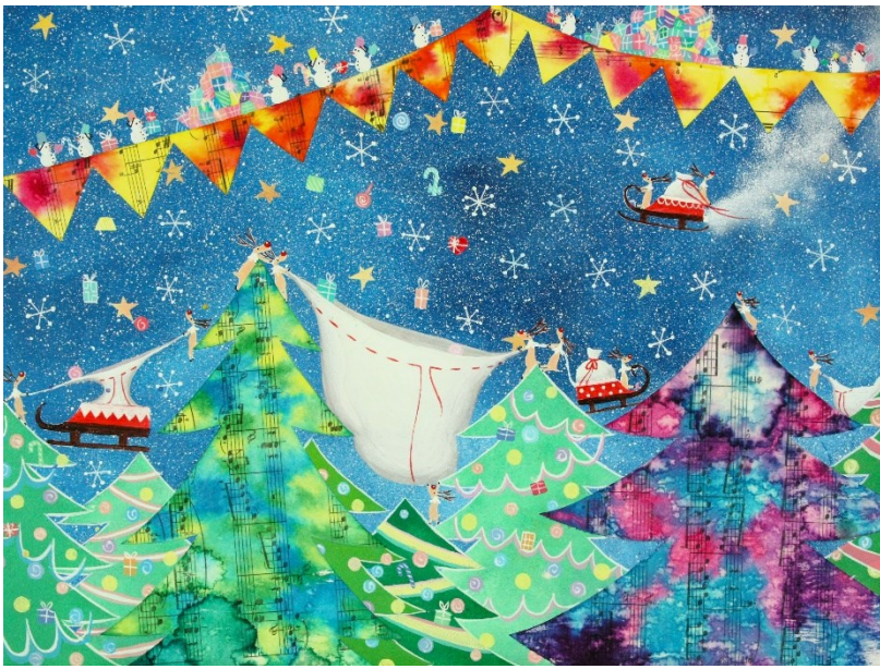
★★ アクリル絵の具+転写